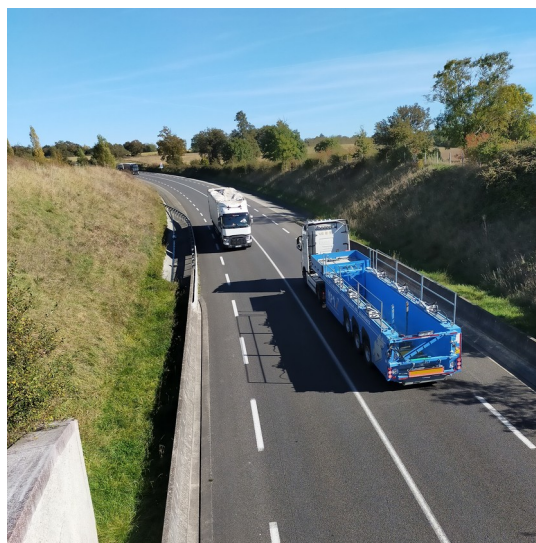
Déviation de Bellac

Mise en service en 2011. 2 x 2 voies sur 7,6 km.