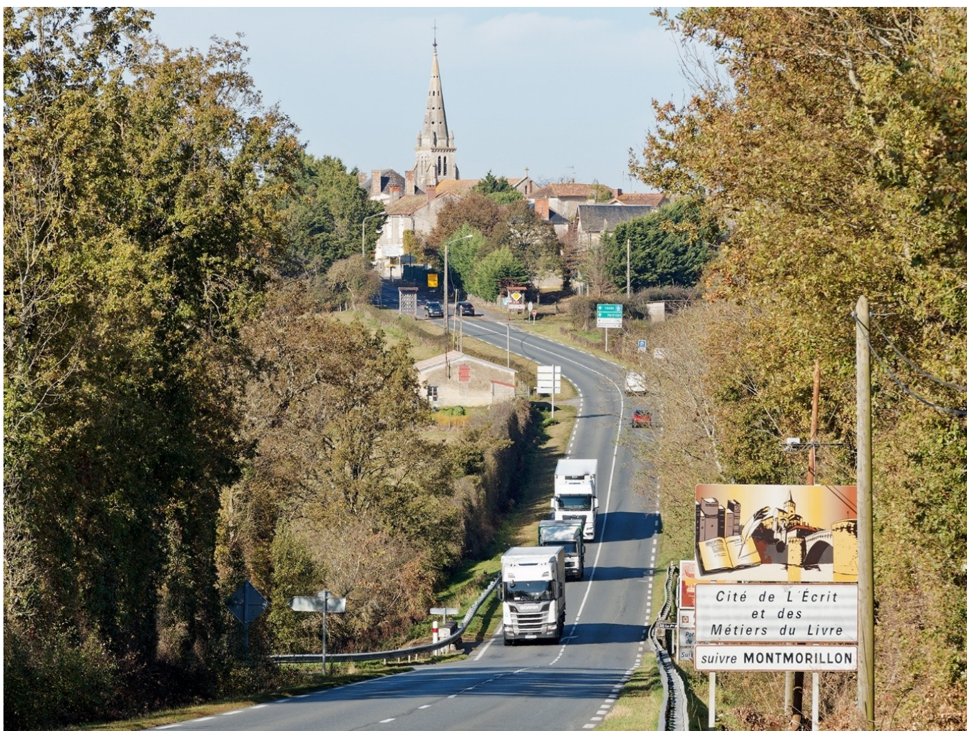
La RN147 dans l'entrée de Moulismes

Ces traversées de bourg sont à l'origine d'accidents et de ralentissements et source de nuisances pour les riverains. Pour autant, la RN147 peut aussi constituer un enjeu économique pour les commerces à destination des usagers (restaurants, stations-services...).